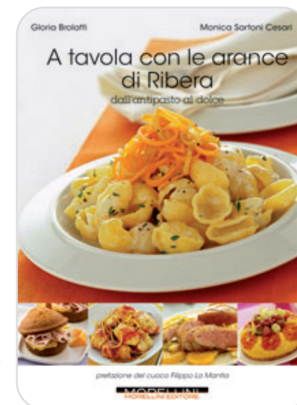
• Copertina del libro

Il libro si trova in libreria ma può essere anche ordinato telefonando al numero : 06 8530 5318.