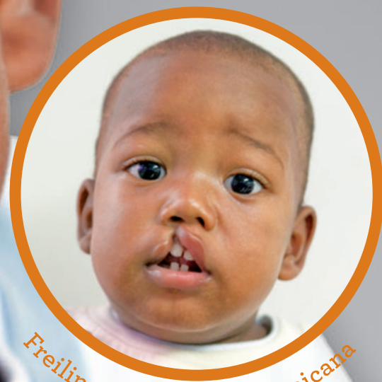
Freilin, Repubblica Dominicana